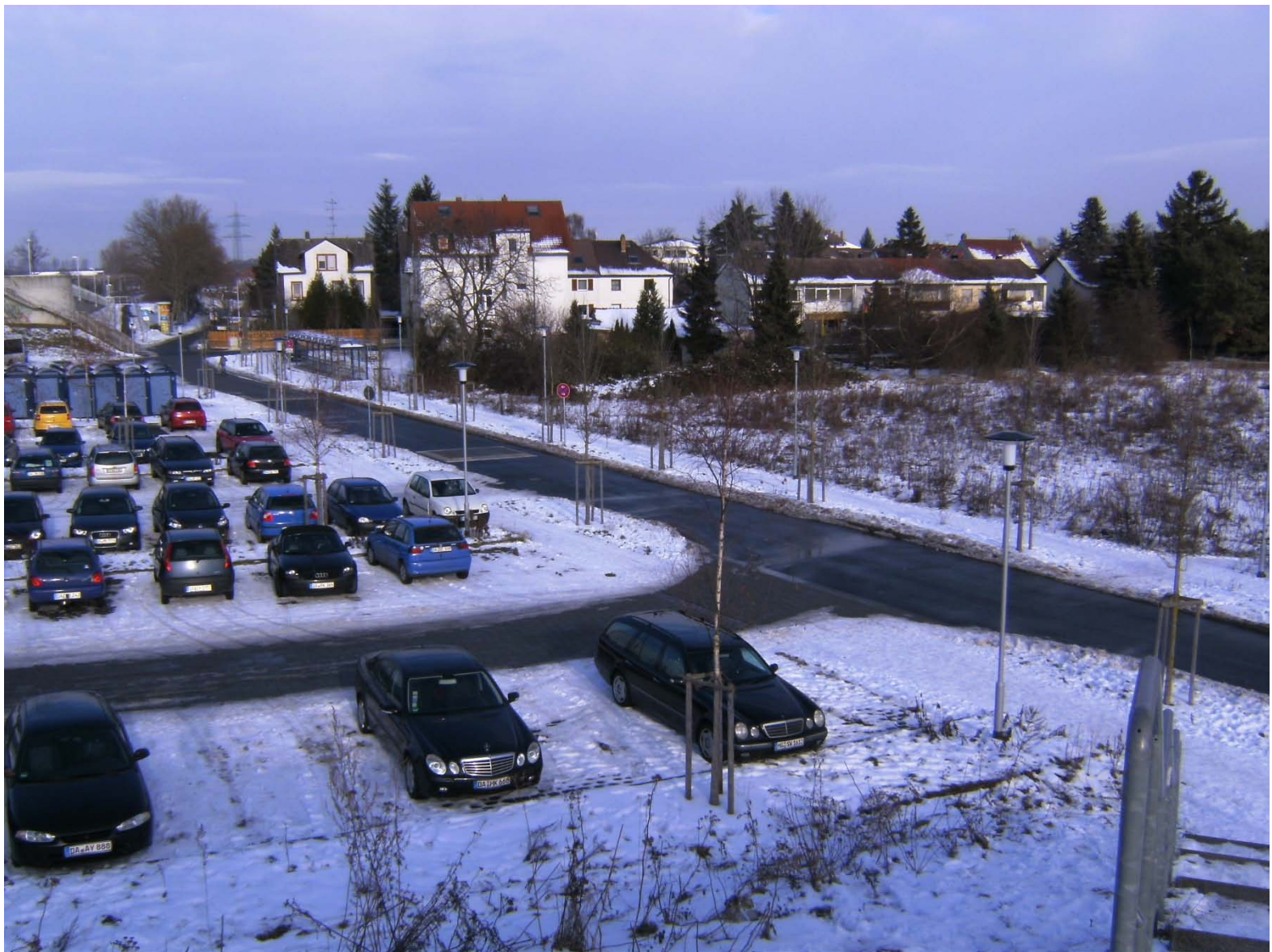
Friedhofserweiterung mit S-Bahn-Anschluss