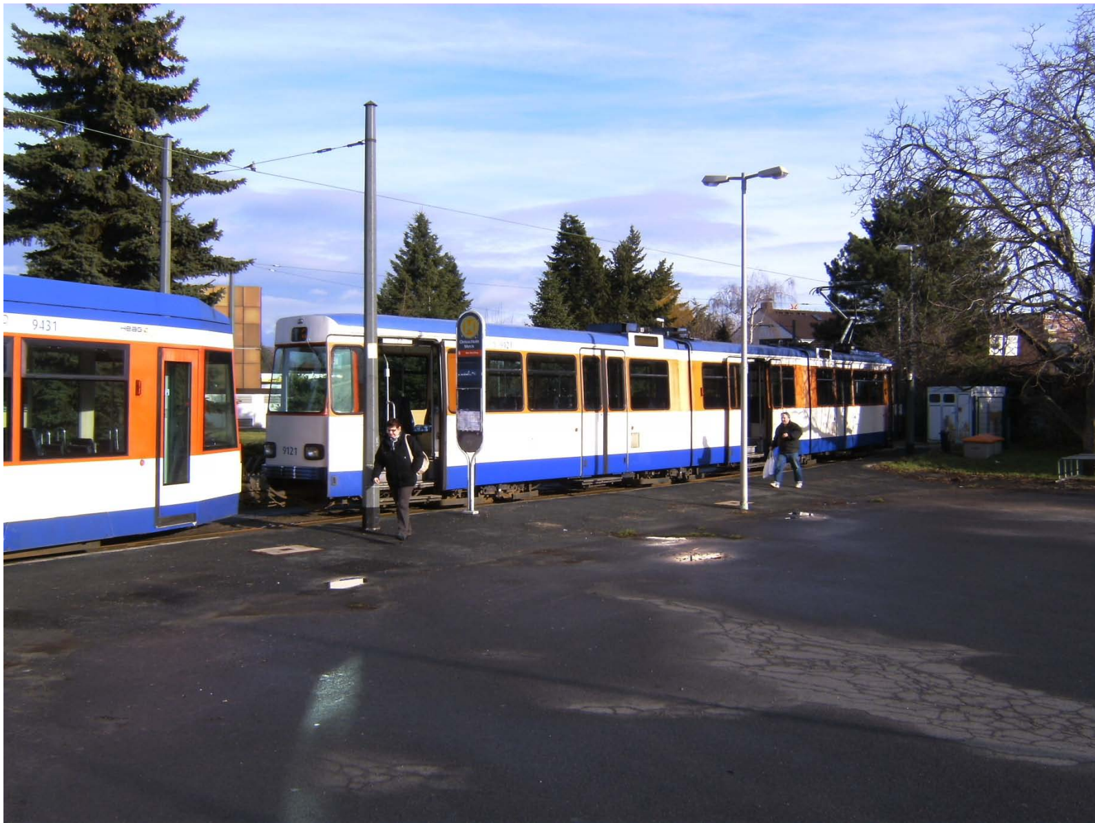
Linie 6: Vier Stunden End-Haltestelle Merck-Schleife