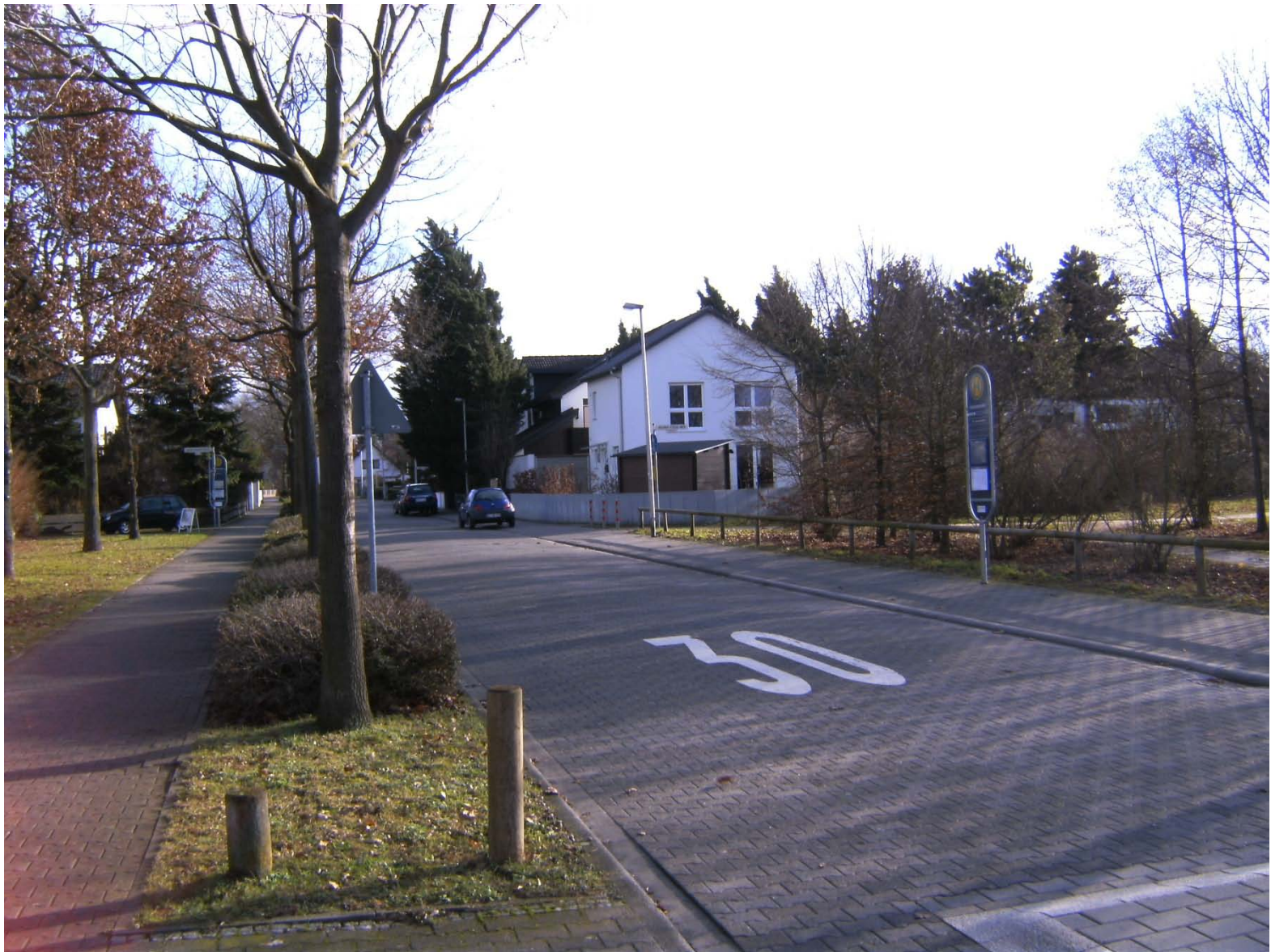
Bushaltestelle Aldi ohne Unterstellmöglichkeit