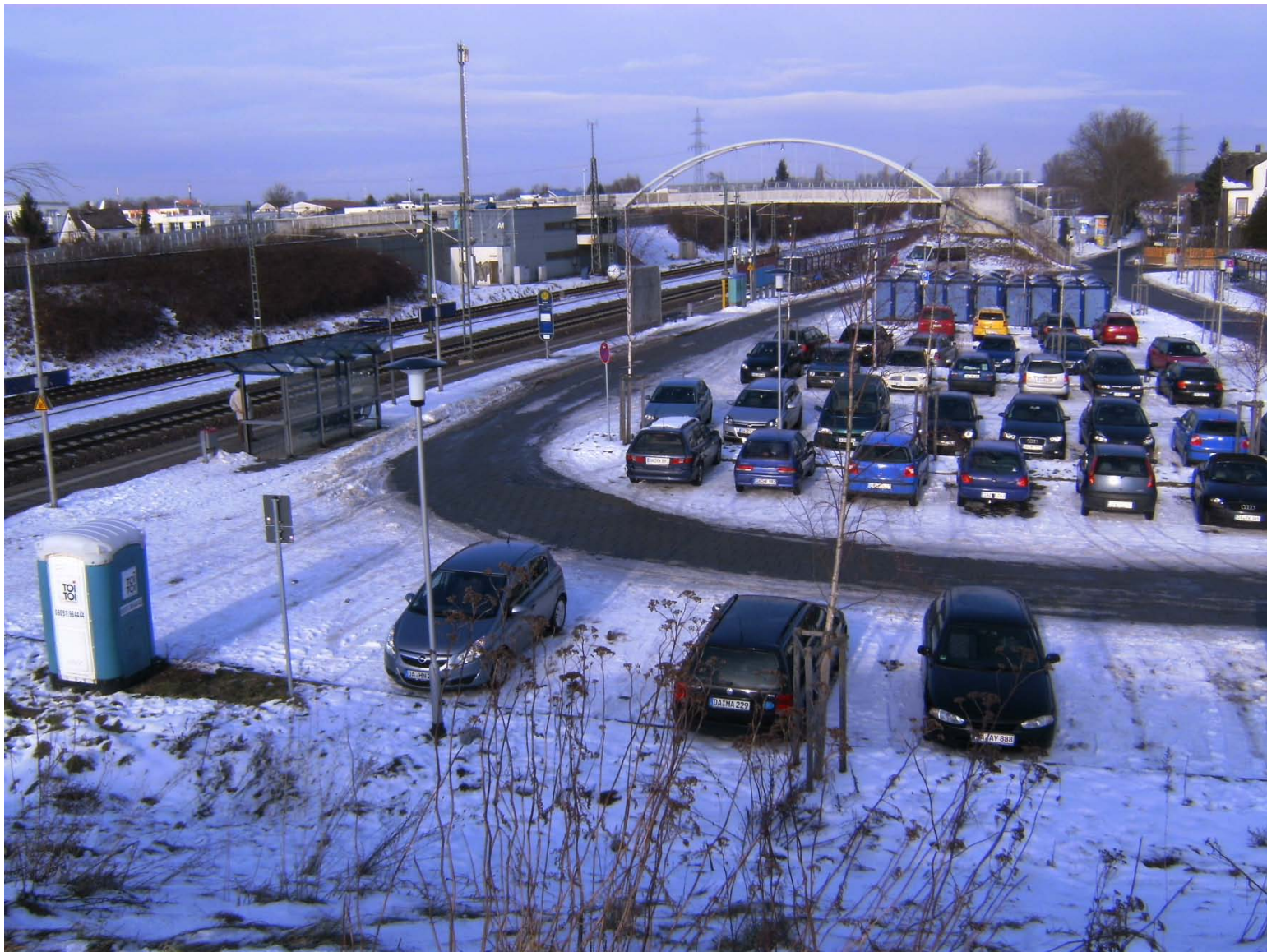
S-Bahn-Haltepunkt Arheilgen ohne Aufenthaltsqualität