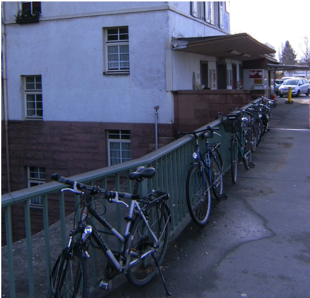
Arheilger Südbahnhof ohne Fahrradständer